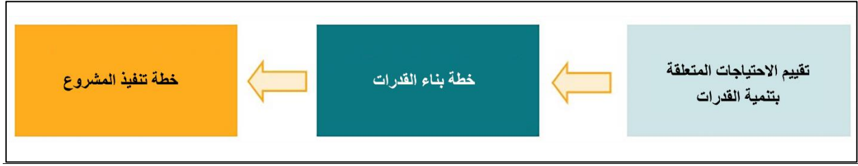
الشكل 1. دعم التخطيط والإعداد في بناء القدرات ودعم التنفيذ المُقدّم للمشاركين اعتباراً من عام 2022